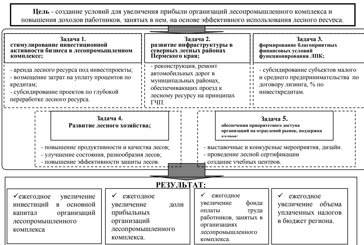
Рисунок 4 – Перспективные направления развития регионального лесопромышленного комплекса

В рамках первой задачи по стимулированию инвестиционной активности бизнеса в лесопромышленном комплексе предполагается реализация следующей цели: повышение инвестиционной привлекательности лесопромышленного комплекса и увеличение глубины и комплексности переработки лесного ресурса. Задача может быть реализована путем предоставления субсидий из бюджета субъекта федерации на возмещение части затрат организациям лесопромышленного комплекса, связанных с реализацией комплексных инвестиционных проектов, которые направлены на увеличение глубины переработки лесного ресурса путем создания новых эффективных производств и комплексного технического перевооружения организаций лесопромышленного комплекса.