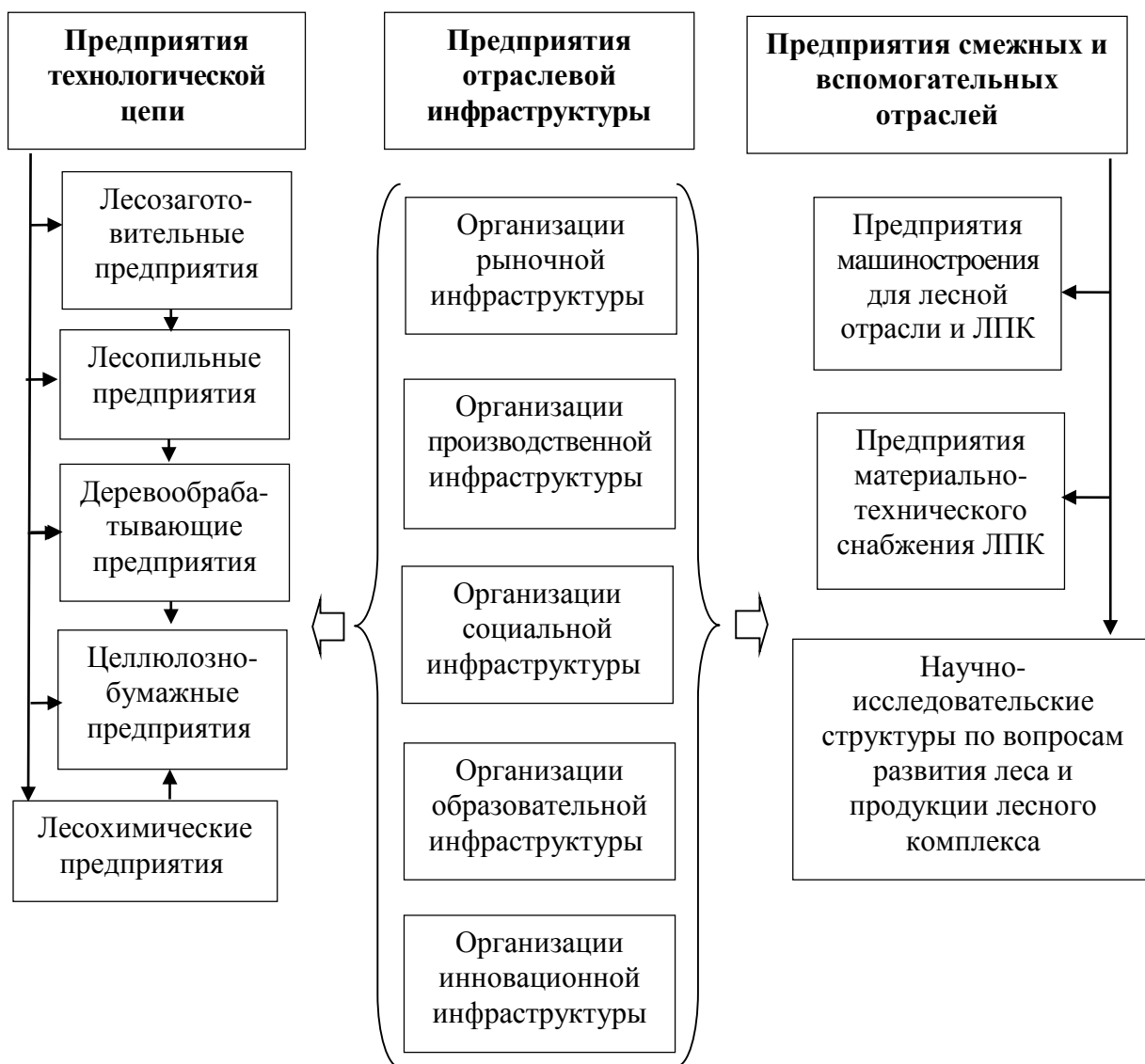
Рисунок 1 - Субъектная структура регионального лесопромышленного комплекса

Согласно нашему подходу, под региональным лесопромышленным комплексом следует понимать сложившуюся систему взаимодействия хозяйствующих субъектов в отраслях и подотраслях лесозаготовительной, деревообрабатывающей, целлюлозно-бумажной и лесохимической промышленности, объединенных по функциональному и территориальному признакам и обеспечивающих создание условий для увеличения прибыли предприятий и организаций и повышения доходов работников за счет добровольной сертификации лесопромышленного комплекса в соответствии с требованиями международных стандартов, создания регионального кластера, вовлекающего в процесс производства крупный, средний и малый бизнес на основе государственно-частного партнерства и эффективного использования лесного ресурса.